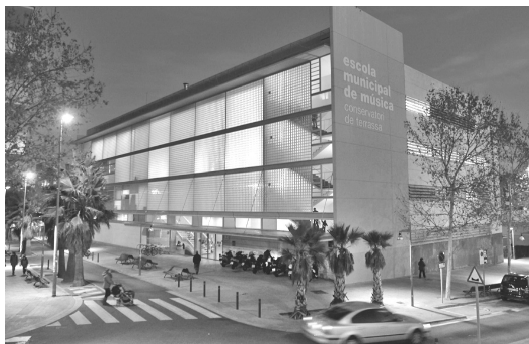
La Escola de Música cuenta con más de cien años de historia.

El calendario para obtener una plaza en la Escola Municipal de Música y Conservatori se alargará hasta julio, cuando se abrirá el periodo de matrícula del 10 al 17 de ese mes.